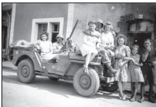
Photo prise au Pont à l'Abbesse à la Libération